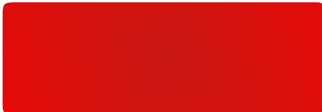
BG 3020 Красный